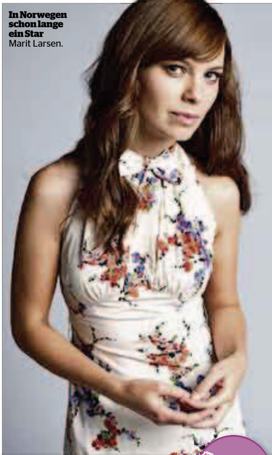
In Norwegen schon lange ein Star Marit Larsen.

Ja, am 27. April kehre ich für ein Zürcher Konzert in die Schweiz zurück. Ich trete in der Härtereier auf, in welcher ich bereits schon einmal ein Konzert spielte. ●